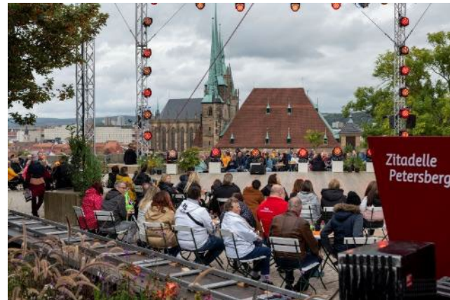
Tag der Deutschen Einheit